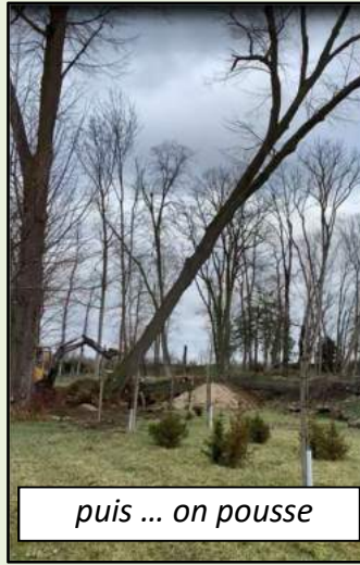
puis ... on pousse