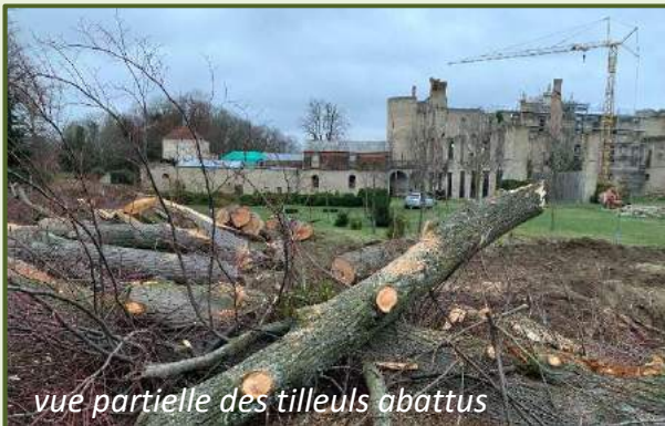
vue partielle des tilleuls abattus