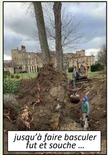
jusqu'à faire basculer fut et souche ...