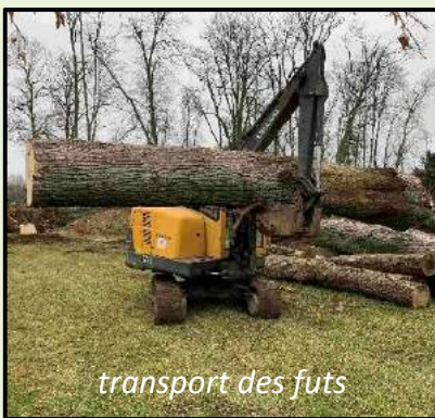
transport des futs