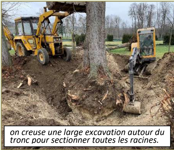
on creuse une large excavation autour du tronc pour sectionner toutes les racines.

Les photos qui suivent montrent les séquences du « processus » d'abattage suivi par Thierry. Ici : périmètre figuré ci-contre.