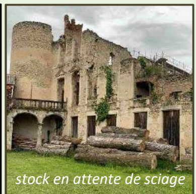
stock en attente de sciage