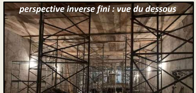
perspective inverse finie : vue du dessous