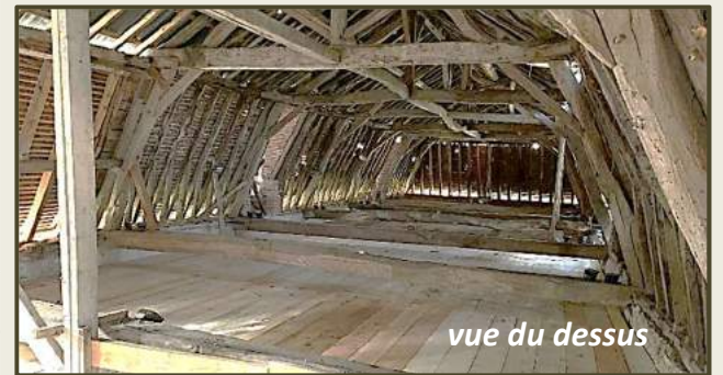
vue du dessus

Les tours d'étais ont été astucieusement construites en triangle par Daniel et Cyril. Alors qu'avec une disposition en carré, nous craignons de manquer d'éléments. Ainsi toute la surface a pu être utilement construite. Ce qui facilite beaucoup les conditions de travail. La surface platelée de cette façon est de plus de 200 m 2 . Cette installation est en place depuis début février et attend les charpentiers qui étaient programmés fin mars.