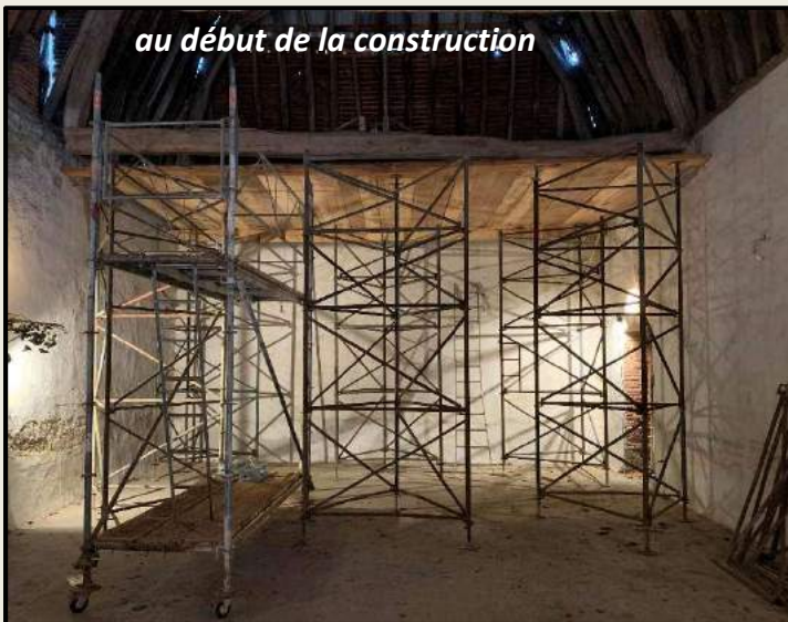
au début de la construction

Comme pour la première partie de charpente, il a fallu créer un platelage (plancher haut). Ici à 4 mètres du sol, au niveau des arases de murs gouttereaux, juste sous les entrails de ferme. C'est une installation de chantier nécessaire pour permettre aux compagnons d'évoluer en toute sécurité et d'accéder aisément aux pièces de charpente. Elle nous sert aussi pour les maçonneries des lucarnes.