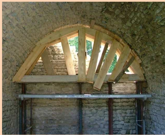
aspects du coffrage des voutes