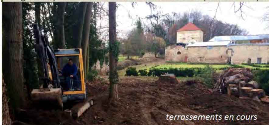
terrassements en cours