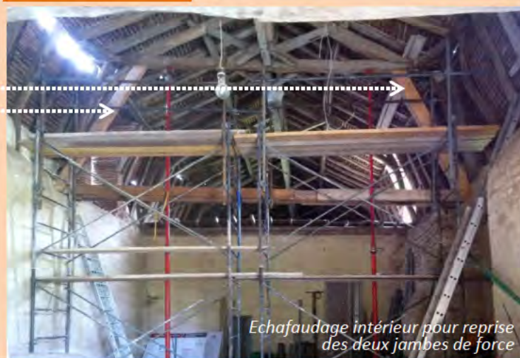
Echafaudage intérieur pour reprise des deux jambas de force