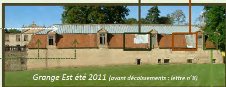
Grange Est été 2011 (avant décaissements : lettre n°8)

En 1995, au tout début du sauvetage du site, les ferrassons ont été couverts en tôles tandis qu'on a seulement fait des retouches aux brisis. Près de 20 ans après, des fuites importantes ont obligé à reprendre