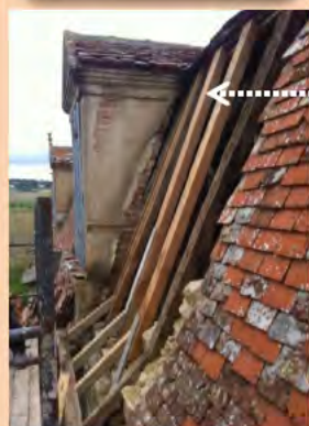
reprise de charpente